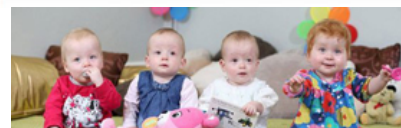
♦ Quadrigêmeas de um casal britânico