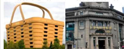
15 construções exóticas do mundo