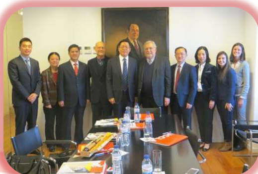
Delegação do Congresso de Jiangsu, novembro 2018