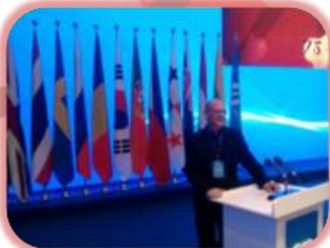
Fórum Mundial das Cidades com Canais, outubro 2018