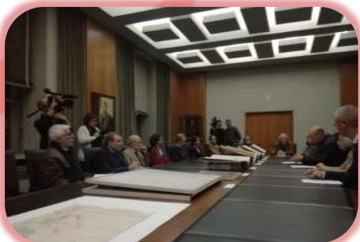
Apresentação da 3.ª Fase da Biblioteca Digital Macau/China, dezembro 2018