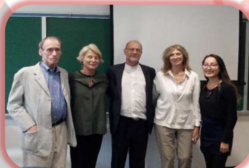
Divulgação dos Projetos do OC a Universidades dos EUA e China, setembro e outubro 2018