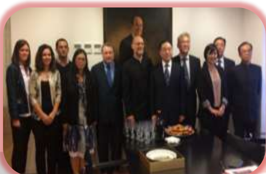
Delegação da Academia Chinesa das Ciências Sociais, outubro 2018

O OBSERVATÓRIO DA CHINA (OC) , fundado a 28 de dezembro de 2005, apresenta a newsletter com as principais iniciativas entre abril de 2018 e dezembro de 2018.